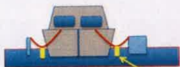
Båter med baugen mot fast brygge

En Daumann løsning vil hindre rykkbelastninger Løsningen vil tåle bedre høy/lav-vann En god løsning på fortøyninger mot fast brygge (Fremre fortøyninger om en har baugen inn)